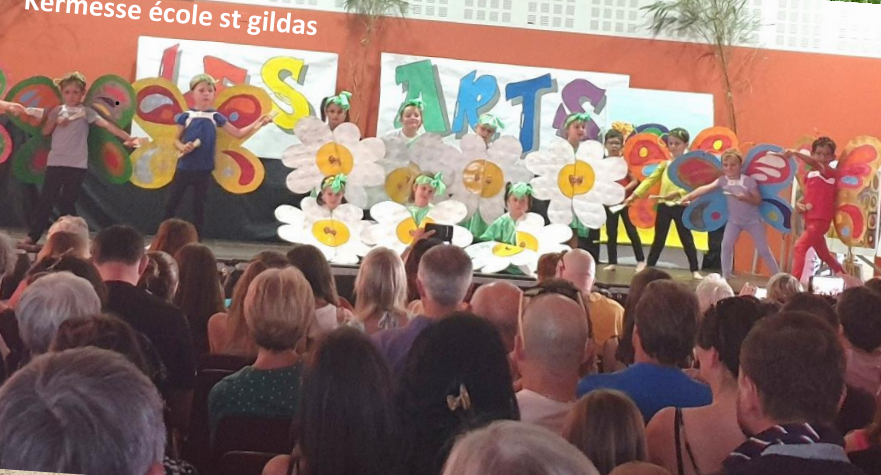
Kermesse école st gildas