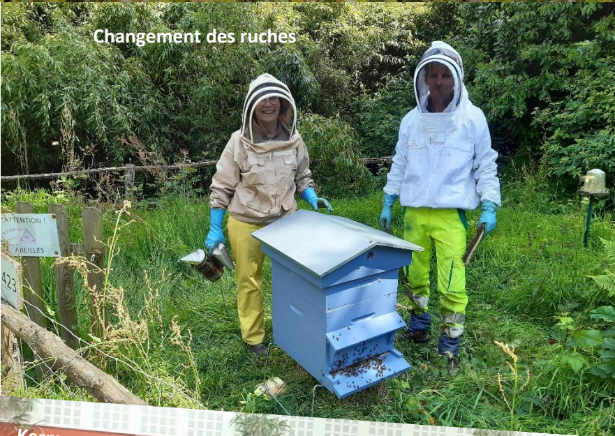
Changement des ruches