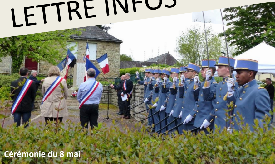
Cérémonie du 8 mai